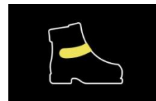
CIERRE MARCA VELCRO®