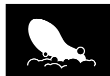
PLANTILLAS EXTRAÍBLES LAVABLES