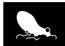
PLANTILLAS EXTRAÍBLES LAVABLES