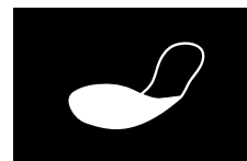
PLANTILLA ANTI- PERFORACIÓN TEXTIL